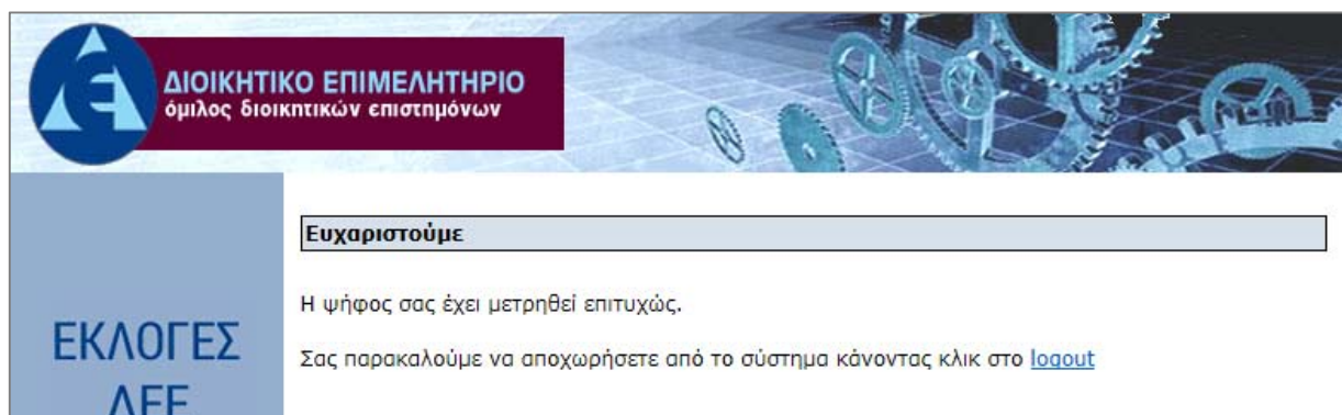
Στιγμιότυπο Οθόνης 6: Η διαδικασία ολοκληρώθηκε