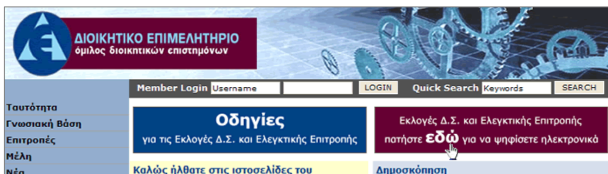
Στιγμιότυπο Οθόνης 1: Πρόσβαση στο σύστημα μέσω της ιστοσελίδας του ΔΕΕ